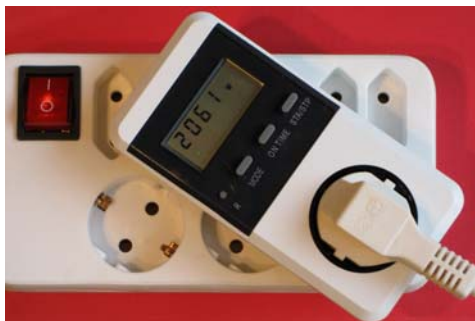
Strommessgerät im Einsatz