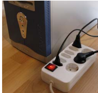
Mehrfachsteckdosenleiste mit Netzschalter

Leerlaufverluste lassen sich nur durch konsequentes Ausschalten und Verzicht auf den „Stand-by“ Betrieb vermeiden. Ist dies nicht möglich, da Geräte über keinen Netzschalter verfügen oder sich nicht komplett ausschalten lassen (Schein-Aus), hilft nur das Trennen vom Stromnetz. Dabei hat sich die Verwendung von schaltbaren Steckdosenleisten sehr bewährt. Mit deren Hilfe lassen sich etwa Computer, Monitor und Drucker nach dem Herunterfahren schnell und bequem mit nur einem Schalter vom Stromnetz trennen.